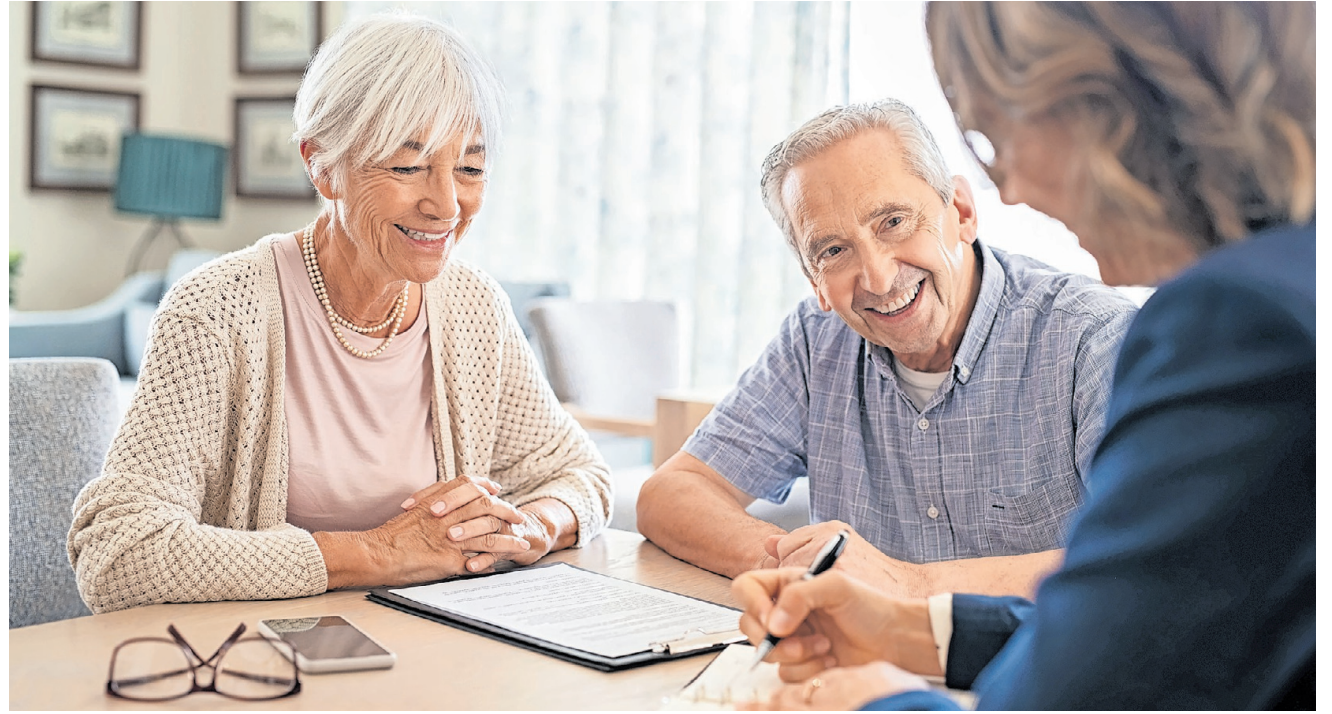
Informations- und Beratungsstelle Alter (IBA) bietet Informationen zu vielfältigen Bereichen.

Die primäre und wohl bekannteste finanzielle Unterstützung sind die Ergänzungsleistungen der AHV, die als jährliche Leistung in monatlichen Raten ausbezahlt wird. Weitere Ergänzungsleistungen sind die Vergütungen von Krankheits- und Behinderungskosten sowie gewisse Hilfsmittel. Die jährliche Leistung, welche als Existenzsicherung im Alter gilt, wird anhand der Gegenüberstellung von anerkannten Ausgaben und den anrechenbaren Einnahmen (unter Berücksichtigung der Vermögenssituation) berechnet. Bei einer alleinstehenden Person, die in einer Mietwohnung lebt, sind die anerkannten Ausgaben im Jahr maximal 35132 Franken. Eine alleinstehende Person, die im Jahr weniger Einkommen hat und nicht über ein grosses Vermögen verfügt, sollte in diesem Fall einen Antrag auf Ergänzungsleistungen bei der AHV einreichen. Für Ehepaare und im Heim lebende Personen gelten andere Berechnungsgrundlagen. Weitere Bestimmungen und Anspruchsvoraussetzungen sind im Merkblatt der AHV-IV-FAK-Anstalten zusammengefasst und online abrufbar. Alternativ kann man